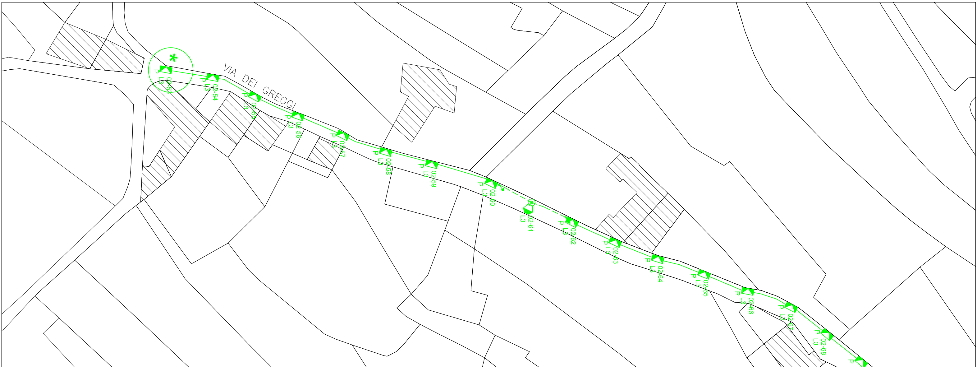
TRATTO NORD DI VIA DEI GREGGI